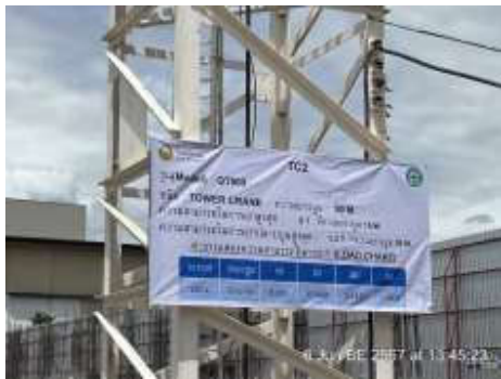
รูปที่ 6 Tower Crane