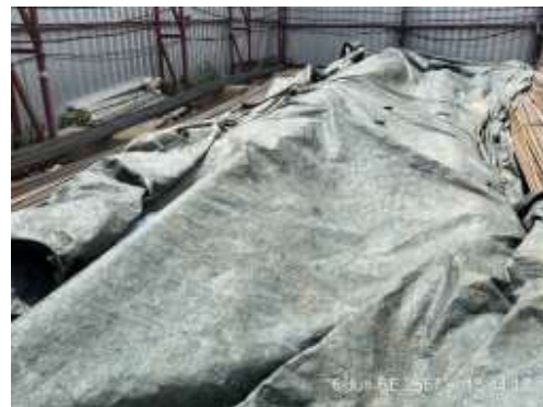
รูปที่ 4 พื้นที่กองเก็บวัสดุ/ปิดคลุมกองวัสดุ