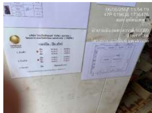
รูปที่ 24 ป้ายประชาสัมพันธ์