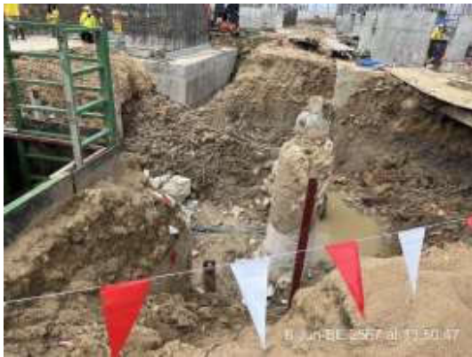
รูปที่ 29 ธงบอกขอบเขตพื้นที่การทำงาน