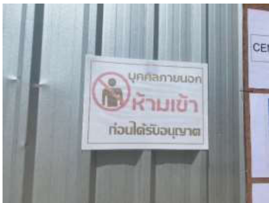
รูปที่ 31 ป้าย “บุคคลภายนอกห้าเข้าก่อนได้รับอนุญาต”