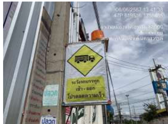
รูปที่ 21 ป้ายเตือนระวางรถบรรทุก