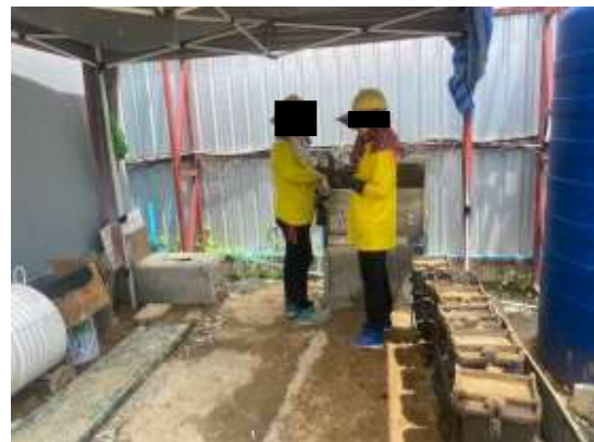
รูปที่ 26 น้ำดื่มสำหรับคนงาน

รวบรวมการปฏิบัติงาน โดยเจ้าหน้าที่ จป. ของโครงการ และทีมงานบริษัท ทีเอ็นพี เอ็นไวรอนเม้นท์ จำกัด