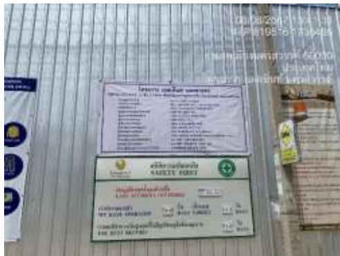
รูปที่ 20 ป้ายสถิติความปลอดภัย