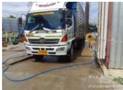
รูปที่ 35 พื้นที่ล้างล้อรถ

รวบรวมการปฏิบัติงาน โดยเจ้าหน้าที่ จป. ของโครงการ และทีมงานบริษัท ทีเอ็นพี เอ็นไวรอนเม้นท์ จำกัด