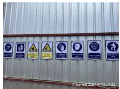
รูปที่ 5 ป้ายเตือนความปลอดภัย