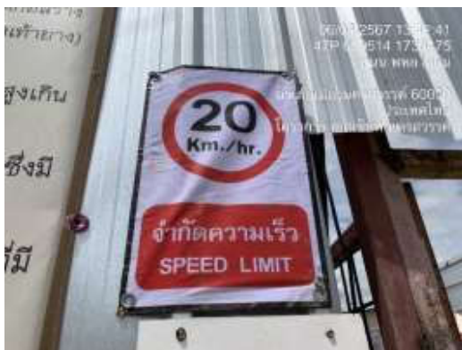
รูปที่ 22 ป้ายจำกัดความเร็ว