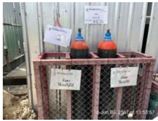
รูปที่ 9 พื้นที่สำหรับเก็บถังลม/ถังแก๊ส