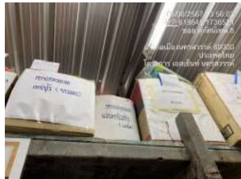
รูปที่ 17 สไตร์