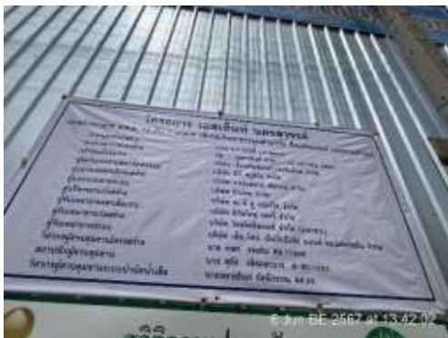
รูปที่ 3 ป้ายรายละเอียดของโครงการ