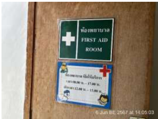
รูปที่ 10 ห้องปฐมพยาบาล/กล่องยาปฐมพยาบาลเบื้องต้น