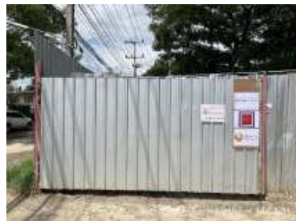
รูปที่ 34 บ้านพักคนงาน

รวบรวมการปฏิบัติงาน โดยเจ้าหน้าที่ จป. ของโครงการ และทีมงานบริษัท ทีเอ็นพี เอ็นไวรอนเม้นท์ จำกัด