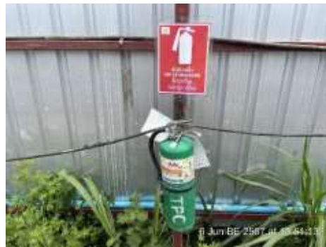
รูปที่ 7 ถังดับเพลิง