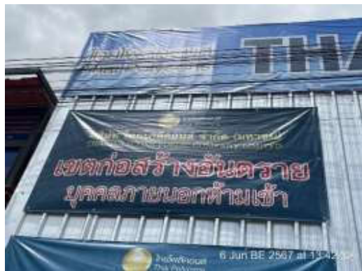
รูปที่ 25 ป้ายเตือนเขตก่อสร้าง