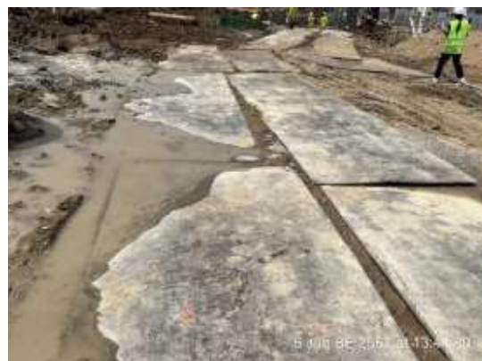
รูปที่ 23 ปูแผ่นเหล็ก

รวบรวมการปฏิบัติงาน โดยเจ้าหน้าที่ จป. ของโครงการ และทีมงานบริษัท ทีเอ็นพี เอ็นไวรอนเม้นท์ จำกัด