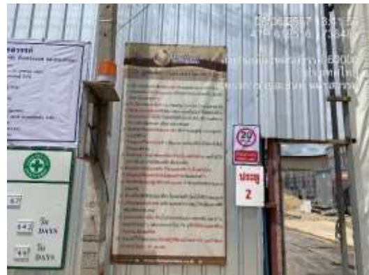
รูปที่ 19 กฎระเบียบการก่อสร้าง