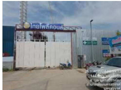
รูปที่ 2 ประตูทางเข้า-ออกโครงการ