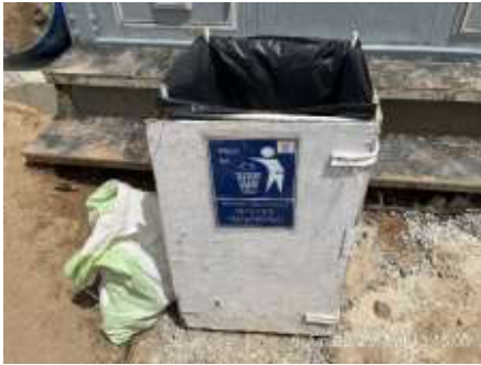
รูปที่ 27 ถังรองรับมูลฝอย