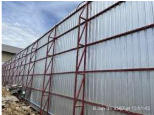
รูปที่ 1 รั้วชั่วคราวเป็นรั้ว Metal Sheet สูง 6 เมตร