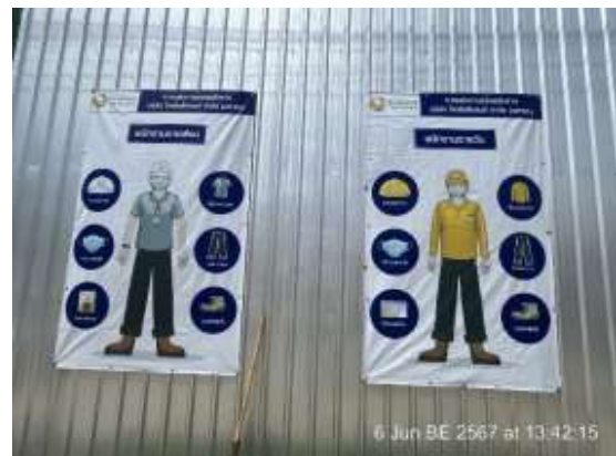
รูปที่ 32 กฎระเบียบการแต่งกาย

รวบรวมการปฏิบัติงาน โดยเจ้าหน้าที่ จป. ของโครงการ และทีมงานบริษัท ทีเอ็นพี เอ็นไวรอนเม้นท์ จำกัด