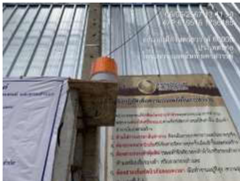
รูปที่ 18 ไฟกระพริบหน้าโครงการ