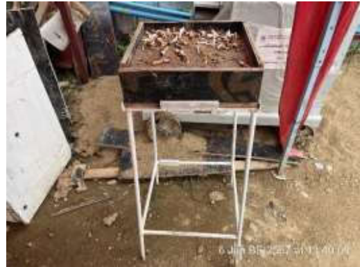
รูปที่ 28 พื้นสำหรับสูบบุหรี่