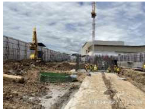
รูปที่ 33 สภาพหน้างานระหว่างเดือนมีนาคม - มิถุนายน 2567