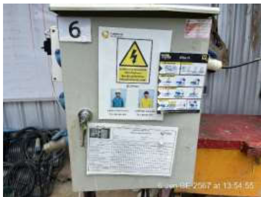
รูปที่ 8 ตู้ไฟฟ้าชั่วคราว