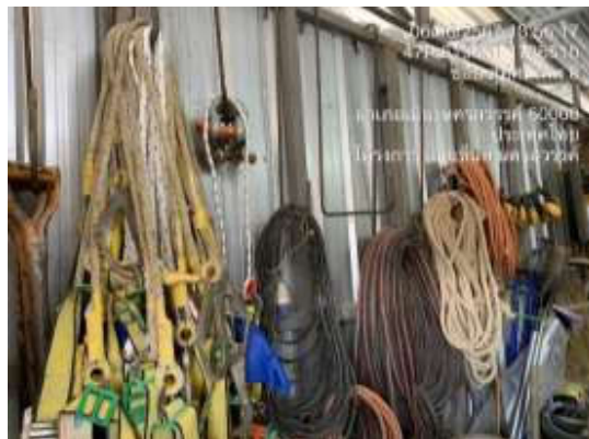
รูปที่ 18 อุปกรณ์ป้องกันอันตรายส่วนบุคคล

รวบรวมการปฏิบัติงาน โดยเจ้าหน้าที่ จป. ของโครงการ และทีมงานบริษัท ทีเอ็นพี เอ็นไวรอนเม้นท์ จำกัด